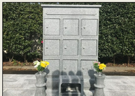
個別墓(のうこつぼ)

十念 本尊「阿彌陀仏」を拝し、南無阿彌陀仏を唱えます。 声に出して十回、南無阿彌陀仏を唱えます。 ① なむあみだぶ ② なむあみだぶ ③ なむあみだぶ ④ なむあみだぶ (息つき) ⑤ なむあみだぶ ⑥ なむあみだぶ ⑦ なむあみだぶ ⑧ なむあみだぶ (息つき) ⑨ なむあみだぶ ⑩ なむあみだぶ 最後の「なむあみだぶ」にて、礼拝をします。